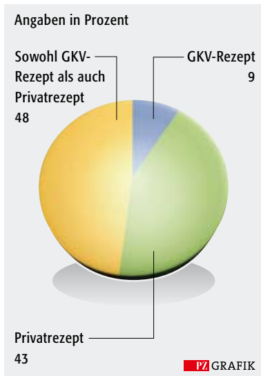
Abbildung 4: Art der Verordnung zu den (vermutet) missbräuchlich angewendeten Hypnotika. GKV-Rezept, =9 Prozent, n=33; Privatrezept = 43 Prozent, n = 162; Sowohl GKV-Rezept als auch Privatrezept = 48 Prozent, n = 181.

men mit weiteren Ärzten (41 Prozent) (Abbildung 3). Die Verordnungen für GKV-Versicherte wurden nur selten ausschließlich zulasten der gesetzlichen Krankenversicherung ausgestellt (8 Prozent). Der Hauptteil war als Privatrezept (43 Prozent) oder alternierend auf Kassenrezept und Privatrezept (48 Prozent) verordnet (Abbildung 4). Bei der Beurteilung des Personenkreises mit vermuteter missbräuchlicher Anwendung von Benzodiazepinen fiel auf, dass sich dieser überproportional stark aus Patienten zusammensetzt, die älter als 65 Jahre sind. Auch Frauen waren häufiger betroffen als Männer (Tabelle 3).